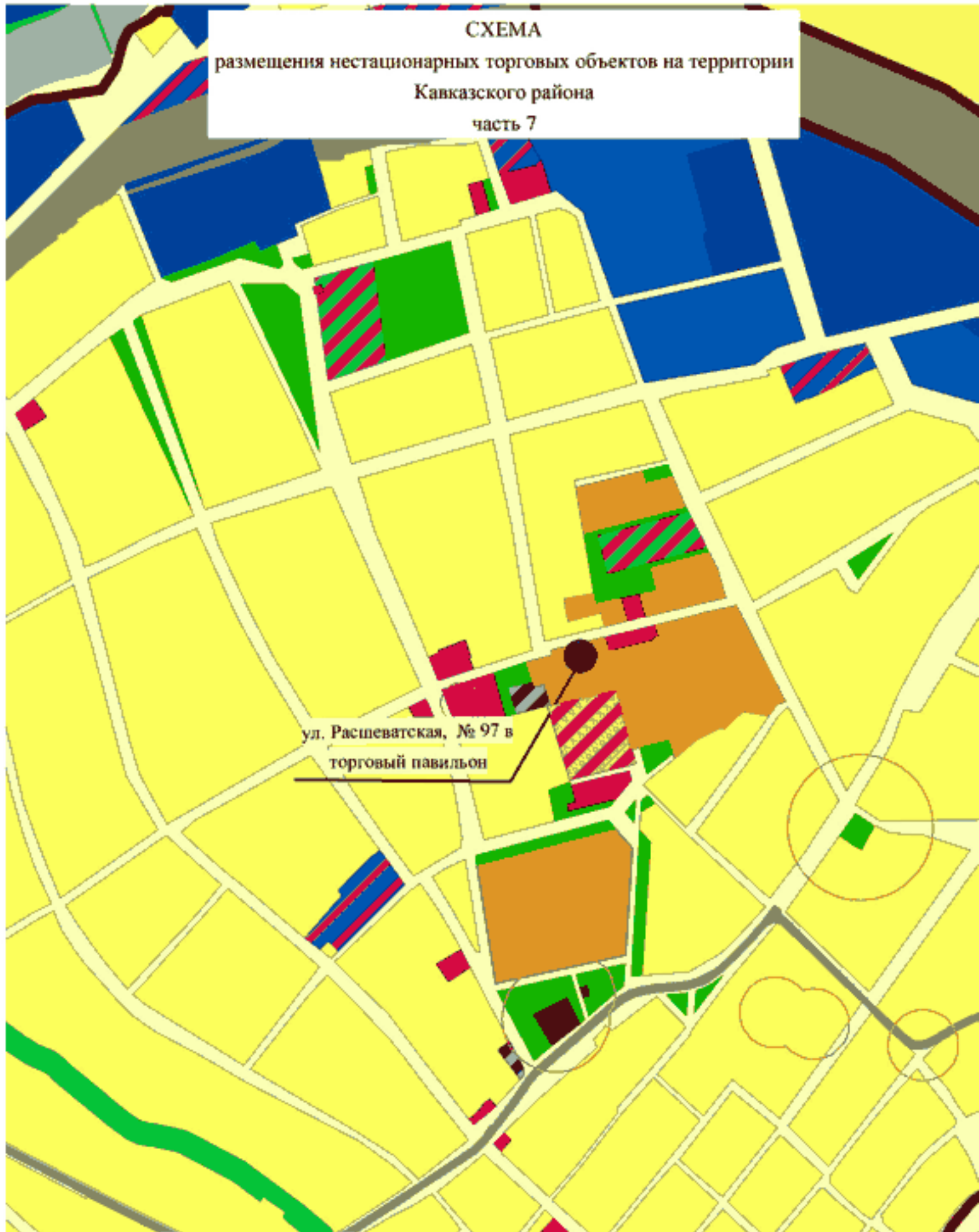
СХЕМА размещения нестационарных торговых объектов на территории Кавказского района часть 7

ул. Распеватская, № 97 в торговый павильон