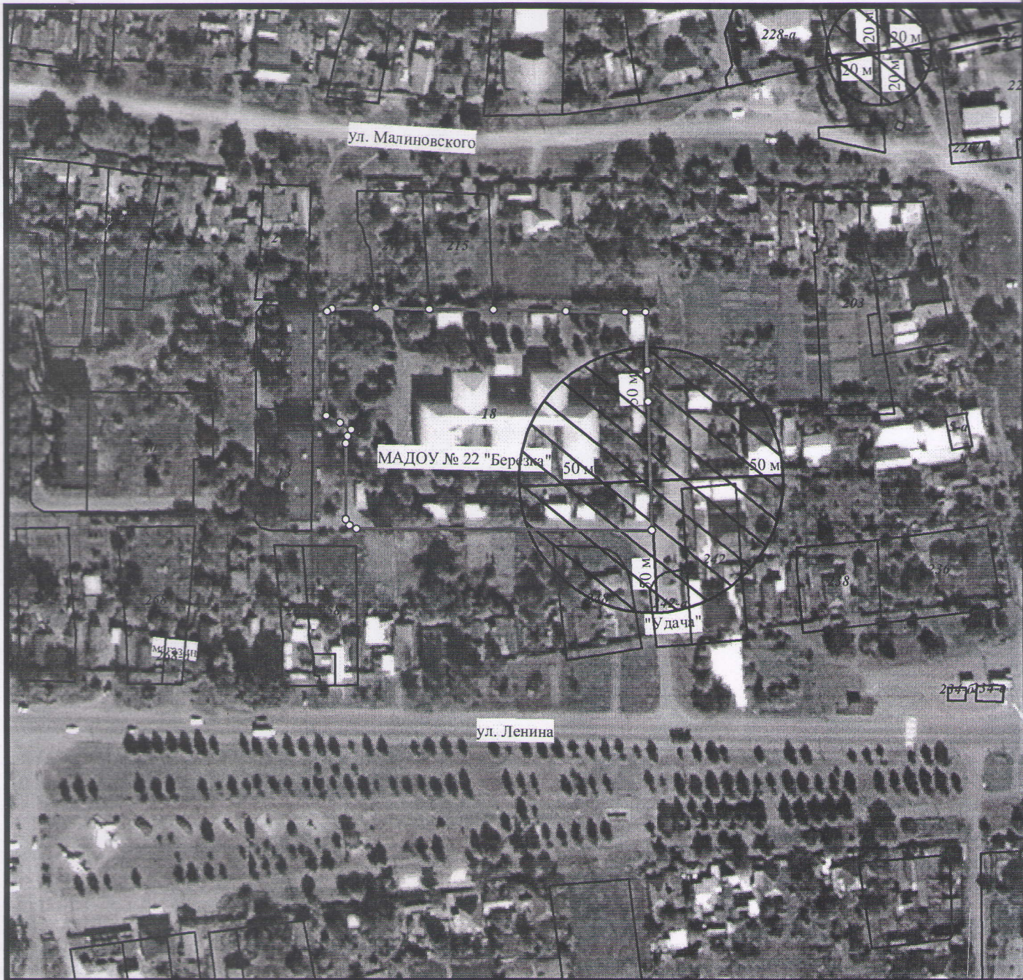
Схема границ прилегающих территорий № 50 М 1:2000

Расстояние радиусом 50 м от входа МДОУ-ЦРР д/с № 22, расположенный по адресу: ст. Кавказская, ул. 60 лет СССР, 18